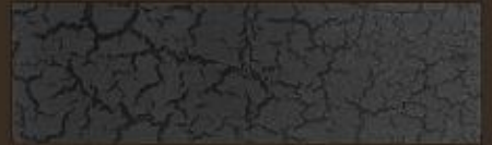
SCREPOLANTE NEUTRO 255 TRANSPARENT CRACKED 255