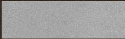
ARGENTO STRONG 3300 N°8 STRONG SILVER 3300 N.8