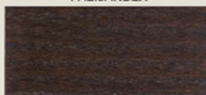
BRUNO ROSSO RED BROWN