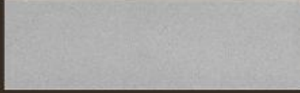
ARGENTO MEDIO 3300 N°5 MEDIUM SILVER 3300 N.5