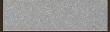
GOFFRATO METALLIZZATO SABBATO 2315 EMBOSSED SANDED METAL EFFECT 2315