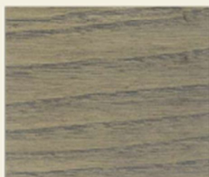
TINTA GRIGIO GLAZE 832 GRAY GLAZE STAIN 832