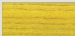
GIALLO SOLE SUN YELLOW