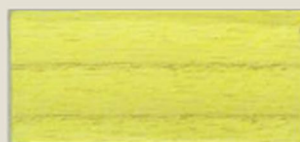
GIALLO LUCE LIGHT YELLOW