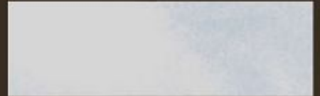
PERLATO FINE 2636 FINE PEARL 2636