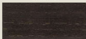
NOCE SCURO DARK WALNUT