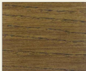
TINTA NOCE GLAZE 3601 WALNUT STAIN 3601

KEMILAC POL. + PATINA ANTICANTE BIANCA 641 03 DUV KEMILAC POL. + PATINA H BIANCA L900