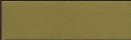
ORO DUCATO 3300 N°7 DUCAT GOLD 3300 N.7