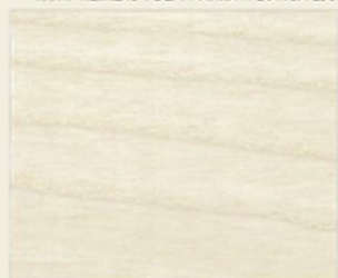
TINTA BIANCA GLAZE 831 WHITE GLAZE STAIN 831