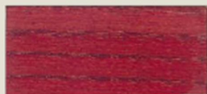
ROSSO FIAMMA RED FLAME