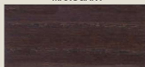
NOCE BIONDO FAIR WALNUT