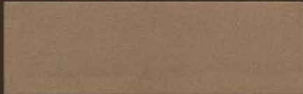
RAME 3300 N°6 COPPER 3300 N.6