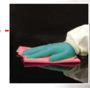
Нова полир кърпа Парт № 50489

Правилното гланциране позволява постигнатият финиш да бъде поддържан оптимално дълъг период от време