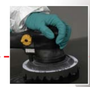
Полир гъба за машина с двойно действие Парт №05729