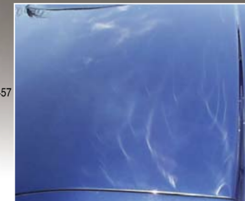
Холограмите често са последица от ротационното пастирание и полиране.