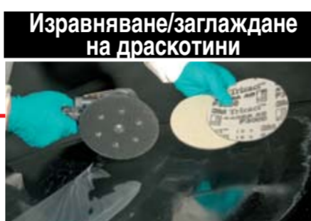
Изравняване/заглаждане на драскотини