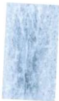
Magnelis® 20 µm след 34 седмици