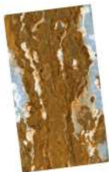
Горещо поцинкован 20 µm след 6 седмици

Тест чрез впръскване на солна мъгла в лабораторни условия