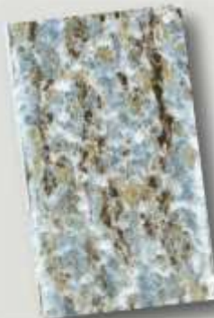
Горещо поцинкован 85 µm след 12 седмици

Тест чрез впръскване на солна мъгла в лабораторни условия