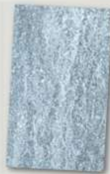
Magnelis® 20 µm след 12 седмици